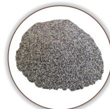
Semi di lino